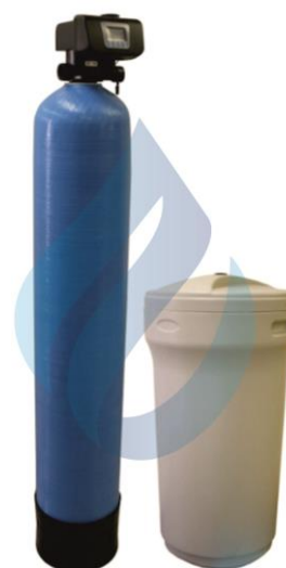
Medidas Vista Frente